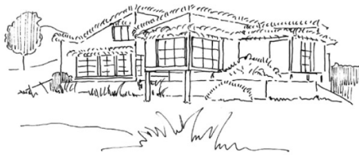
Maison de vacances à Karuizawa_ RAYMOND Antonin

Mais L'archipel de la maison c'est quoi dans le fond ? Et bien nous avons ici un livre qui a pour vocation de nous faire découvrir davantage la maison japonaise en nous expliquant en premier lieu ce qui diffère dans notre façon de concevoir l'habitat, notion qui est très différente au Japon. Par la suite, le livre nous propose de revenir sur quelques maisons d'antan qui ont marqué les esprits, soit par leur originalité, soit par leur façon de révolutionner quelques codes pourtant déjà établis. Mais enfin le plus intéressant reste à venir : 20 maisons contemporaines ont été sélectionnées et étudiées. Le choix est d'ailleurs de qualité, car chacune porte un intérêt majeur à être découvert puisqu'aucune ne se ressemble.