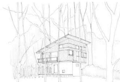
Maison en forêt Karuizawa _ YOSHIMURA Junzô